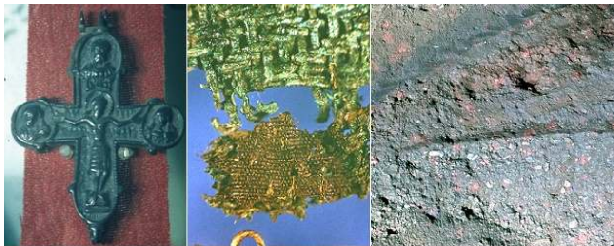
Cruce relicvar, fragment de podoabă din necropolă, urme ceramice în stratul de cultură

Cele mai interesante descoperiri s-au făcut în secțiunea centrală, un șanț adânc și lat de circa doi metri (se vede în fotografie) ce traversează central ambele incinte I și II. Nu am văzut niciodată atât de multe cioburi, de toate mărimile, ceramică arsă și nearsă, ceramică galben cărămizie, roșie sau neagră, cu sau fără decor liniar, lucrată manual sau cu roata, smălțuită sau nesmalțuită. De departe însă, cele mai multe cioburi au fost încadrate pentru cultura Coțofeni, o variantă locală a culturii Linear, cu debut în mileniul al III-lea îen, în zona noastră etichetată drept cultură dacică. Evident că majoritatea cioburilor nu sunt din mileniul III îen, ci din epoca feudală, dar respectă o tradiție de manufactură transmisă din generație în generație. Stratul de cultură ceramică (este încă acolo) are o grosime totală de peste doi metri, fapt ce atestă cei 2000 de ani de istorie. Mai este și un strat gros din dale din piatră calcară, cu grosimea de 2-3 cm.