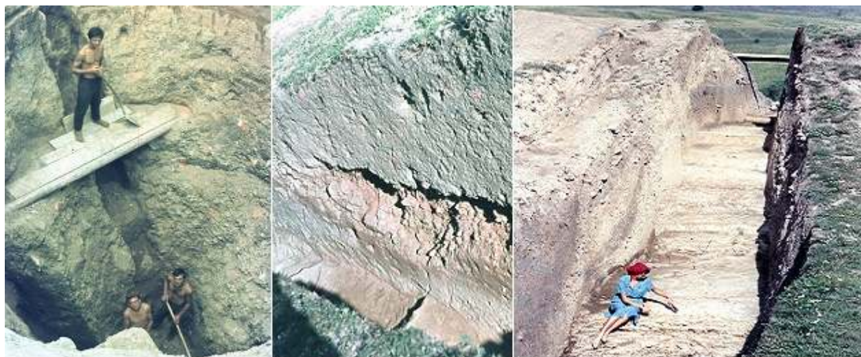
Explorare în puțul fântânii, stratul de lut sub humus

Fiind o cetate reprezentativă pentru epoca marilor migrații, cercetătorii au concluzionat că a este vorba despre o cetate păgână, fără altar sau biserică. Sunt convins însă că viitoarele cercetări vor scoate la lumină noi elemente interesante. În prima incintă s-a lucrat mult și la un puț, despre care se credea că este o fântână (sau că ascunde o comoară). Din lipsa unor structuri de consolidare corespunzătoare, excavația s-a oprit după circa 7 metri, dar este probabil că în timpul cetății puțul ajungea până la nivelul freatic al apei din pârâul învecinat. Cum au săpat anticii un puț atât de adânc, cu unelte primitive? Istoricii credeau că a fost construit la suprafață un cofraj din scânduri, legate cu funii din cânepă pe un schelet din bușteni de brad, înalt de 30 de metri. Pe măsură ce au săpat la bază, cofrajul a căzut sub acțiunea gravitației și a protejat pereții puțului. Pământul se scotea cu un scripete și o găleată.