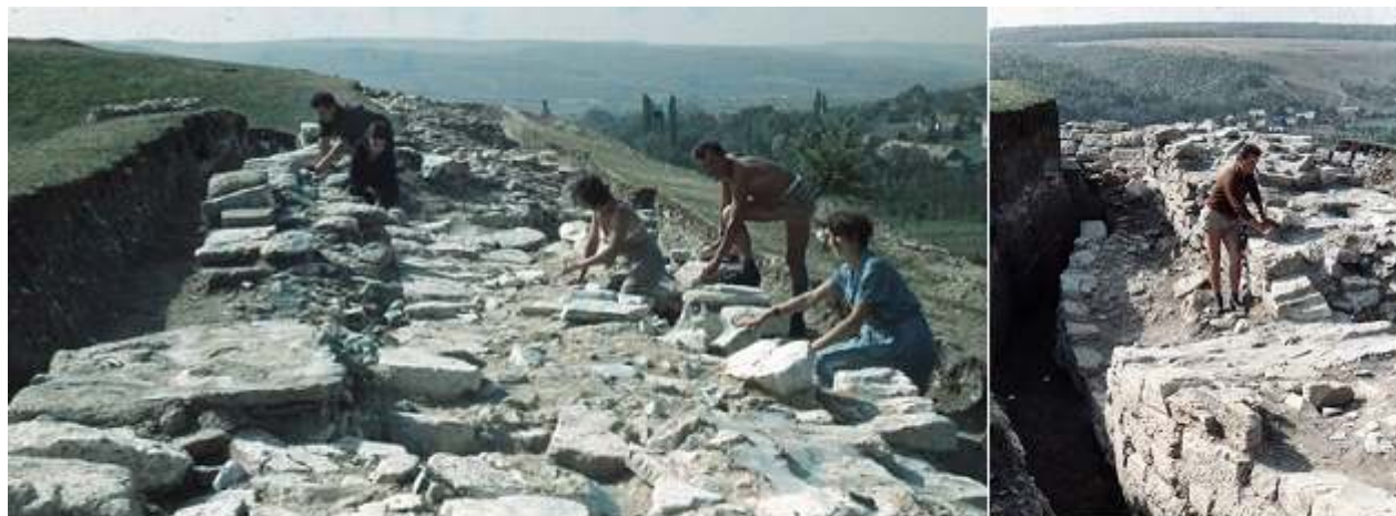
Zidul de la incinta a III-a, secțiunea inițială de suprafață, apoi spre adâncime la 2,5 metri

Zidul din piatră era complet îngropat în pământ, uneori până la adâncimi mai mari de 2,5 metri. În zid s-au identificat numeroase blocuri fasonate din tuff vulcanic, cu șanțuri de fixare de tip "șanț-babă", semn că proveneau dintr-o construcție de calitate superioară, cel mai probabil de la o biserică romanică, ulterioară secolului XII. Ca urmare, zidul a fost datat ca etapă constructivă pentru secolele XIII-XIV.