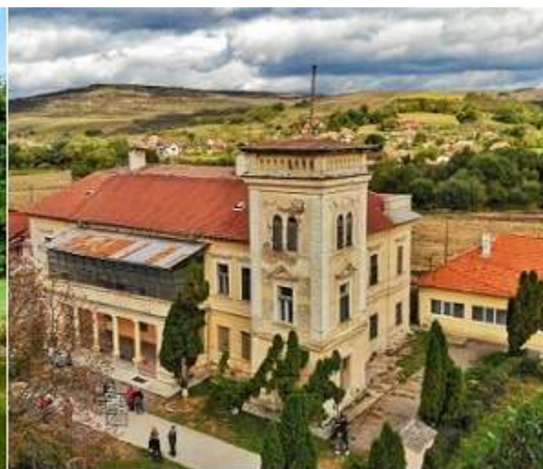
Castelul Banffy din Borșa