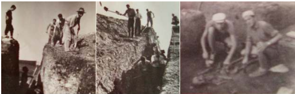
Lucrări la secțiunea centrală în anul 1966