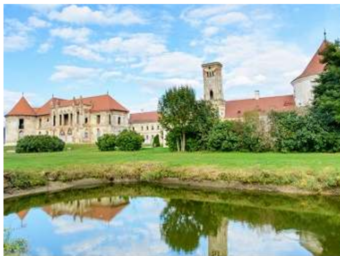
Castelul Banffy din Bonțida