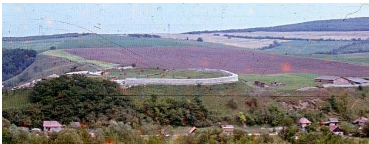
Cetatea Dăbâca văzută din perspectivă laterală, cu întreaga terasă și terenul agricol învecinat

Situată pe o terasă superioară a văii Lonei, la circa 30-40 de metri deasupra nivelului apei, în anii 1960 cetatea era teren agricol, cultivat cu porumb. Ruinele au fost semnalate încă din anul 1837, când K. Hodor descria o cetate feudală suprapusă peste o cetate dacică. Agricultorii moderni au observat în arătură un foarte bogat material ceramic și au anunțat Muzeul de Istorie din Cluj.